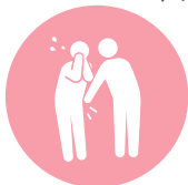
セクシュアル ハラスメント