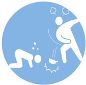
アカデミック ハラスメント