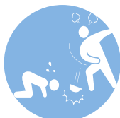
アカデミック ハラスメント