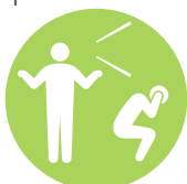
モラル ハラスメント