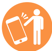
ソーシャルメディア ハラスメント