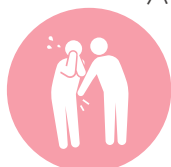
セクシュアル ハラスメント