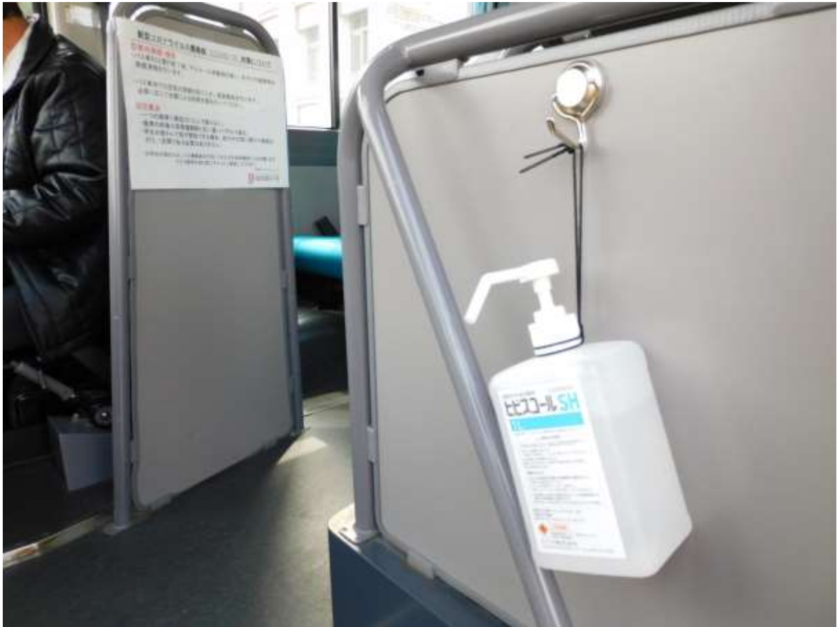
「スクールバス乗降口にも手指消毒剤を設置」