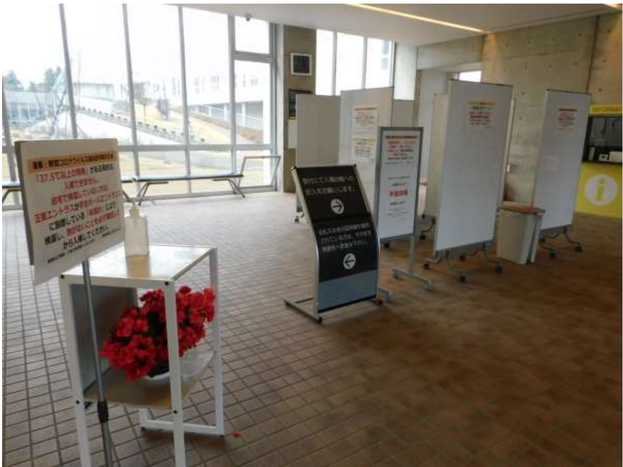
「エントランス部のポスター、手指消毒剤、体温計測ブースの全景」