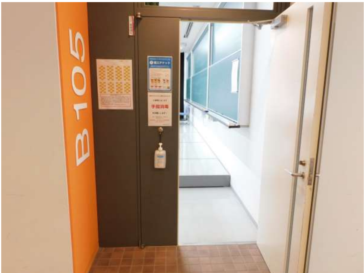
「全ての講義室・実習室等に注意喚起ポスターと手指消毒剤を設置」