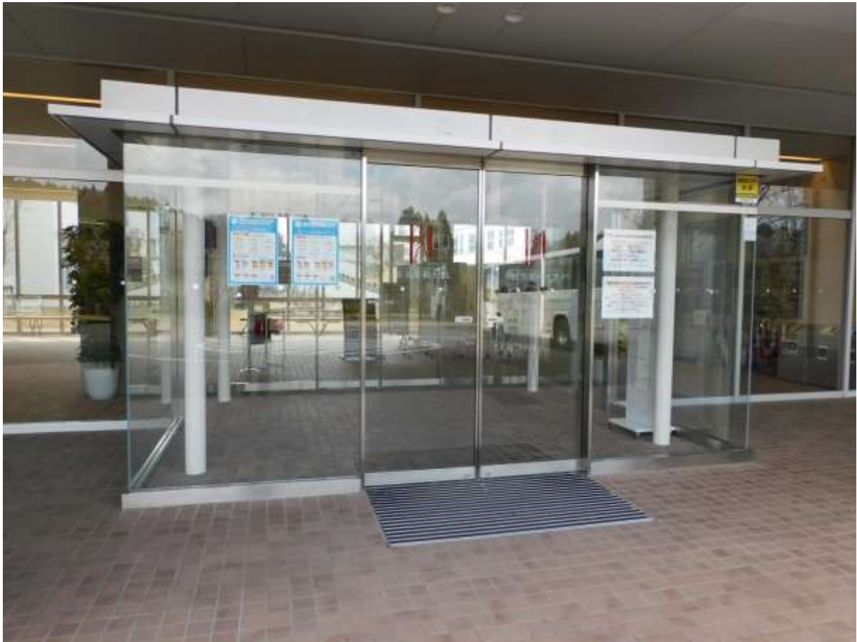
「新型コロナウイルス」に関する注意喚起ポスター（正面エントランス）