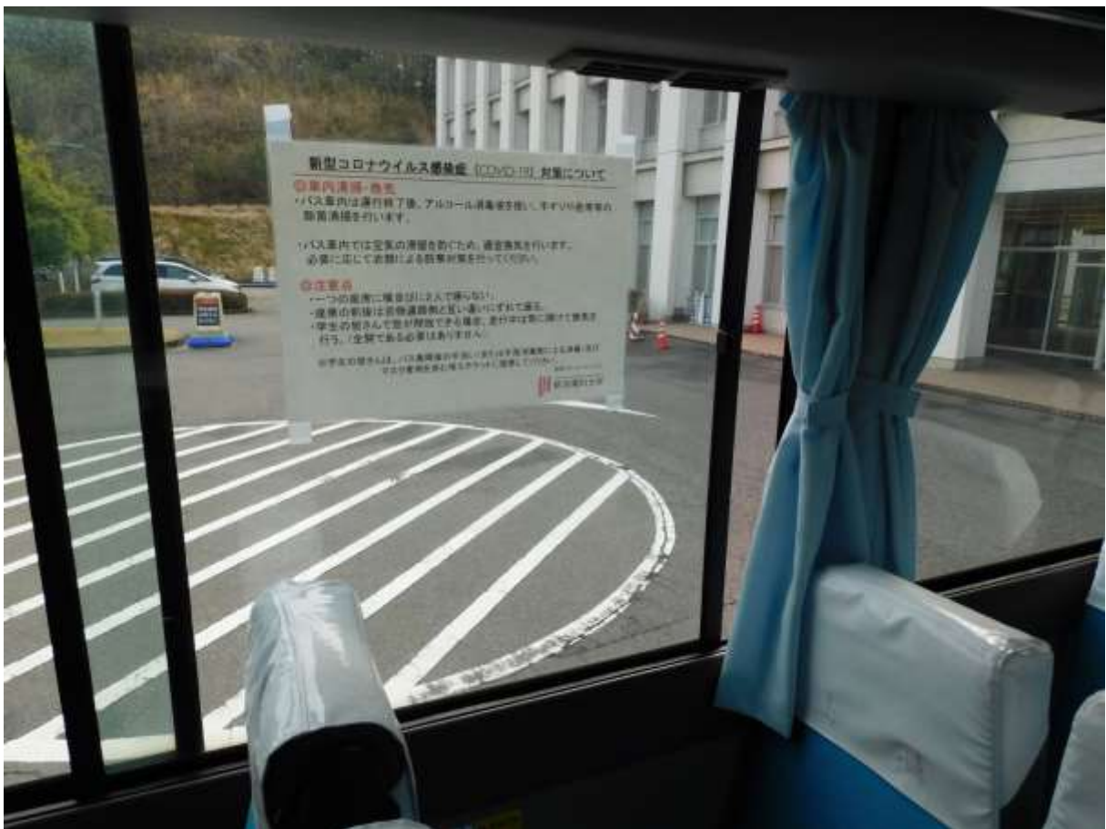
「注意喚起ポスターの設置と窓の開放による強制換気の実施」