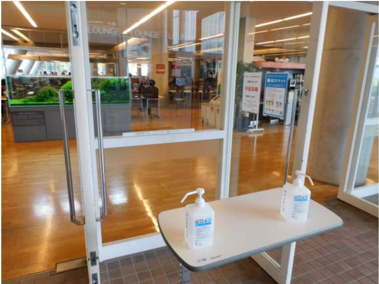
「カフェテリア入口にも手指消毒剤を設置」