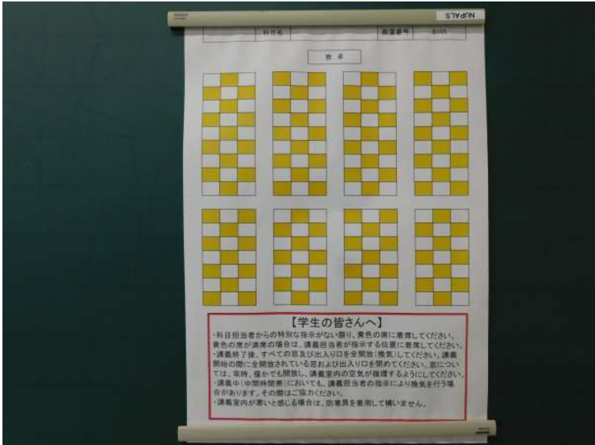
「蛍光色は『講義室』の着席可能席（間隔を保って着席）」