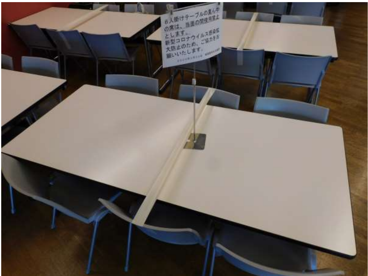
「6人掛けテーブルを4人掛けに変更（中央席は固定）」