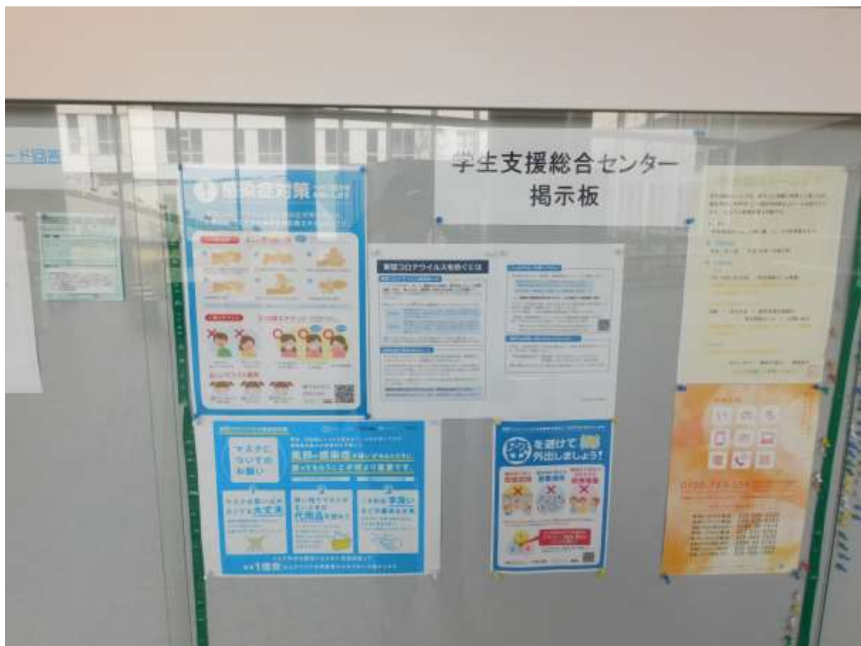
「学生掲示板には最新情報を掲示」