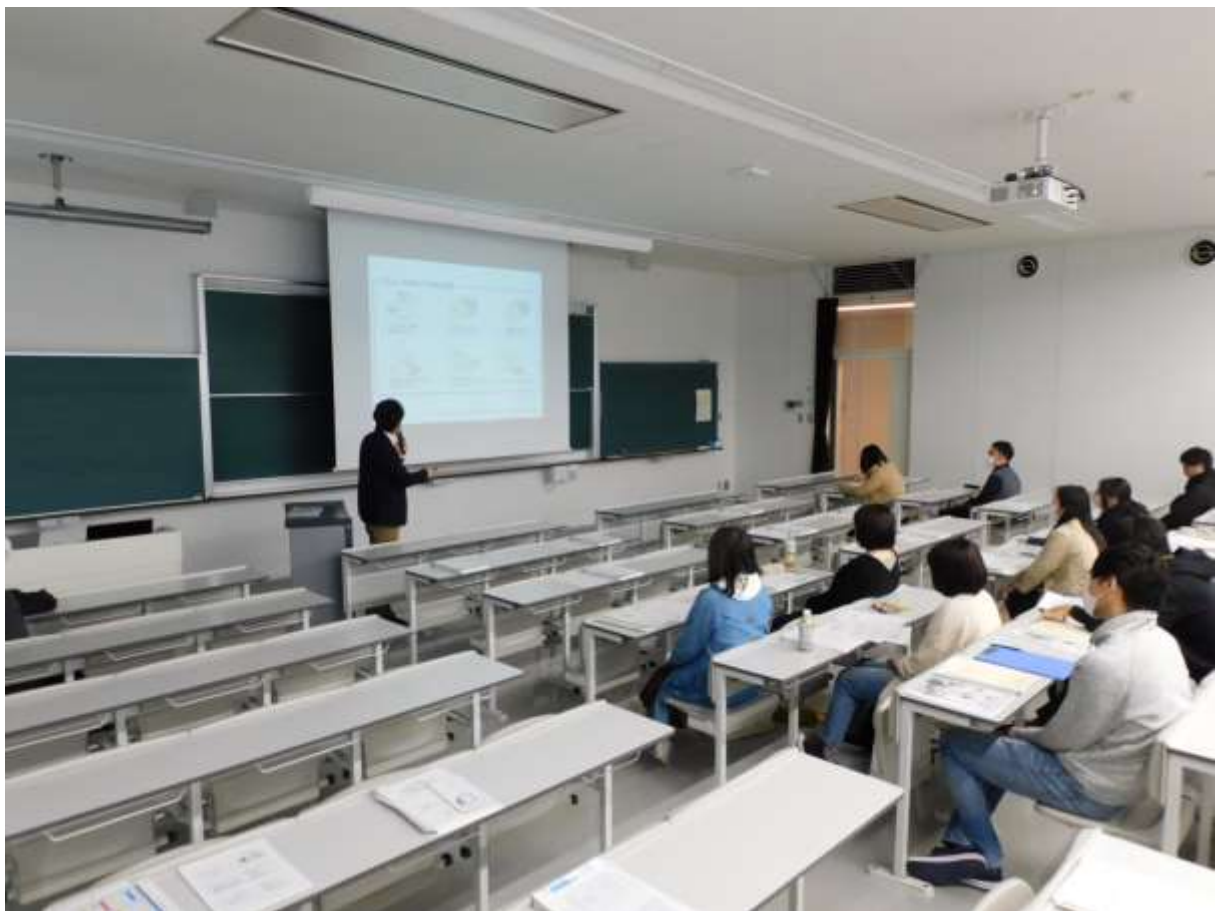
「オリエンテーション風景（スタッフが「感染症対策」について説明）」