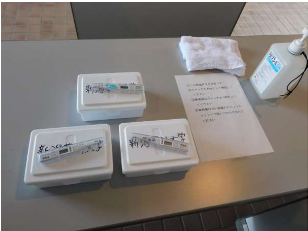
「貸出し用体温計と消毒用ティッシュ」