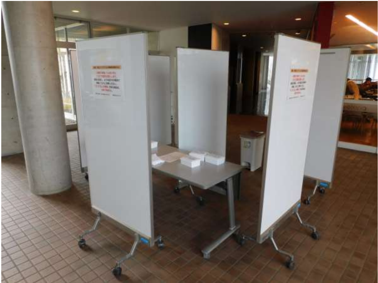
「学生ホールエントランスの体温計測ブース」